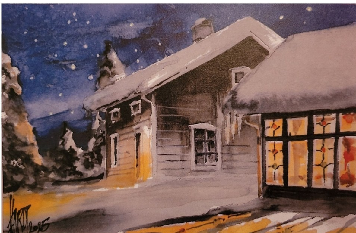
Granvåg i vinternatten – akvarell av Michael Hardt