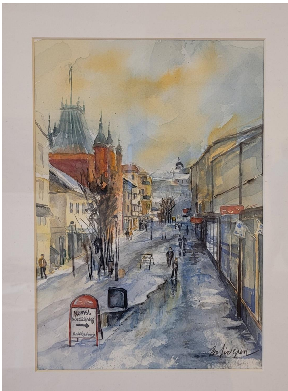
Storgatan Sollefteå – akvarell av Bo Lidgren