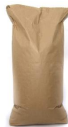
Säck betong 200,00 kr

Sollefteå Konstförening har till byggandet bidragit med en säck betong!